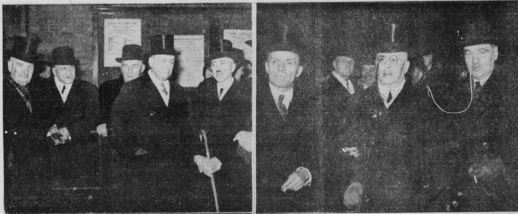
Dans la vignette de gauche, à l'arrivée des restes mortels à la gare du Palais, on remarque, de gauche à droite: l'hon. A.-V. ROY, C.-L.; le maire LUCIEN BORNE, de Québec; l'hon. PIERRE-E. CÔTÉ, ministre provincial des terres et forêts, de la chasse et des pêcheries; l'hon. WILFRID GIROUARD, procureur général de la province de Québec. Dans la vignette de droite: l'hon. ADELARD GODBOUD, premier ministre de Québec; sir EUGENE FISET, lieutenant-gouverneur de la province; l'hon. C.-G. POWER, ministre de l'air dans le cabinet King.