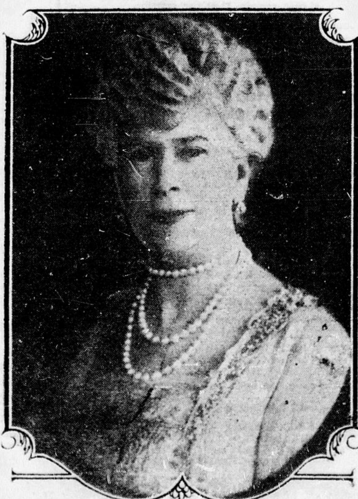
SA MAJESTÉ LA REINE MARIE d'Angleterre, plongée dans un deuil cruel par la mort de son époux, le roi Georges V.