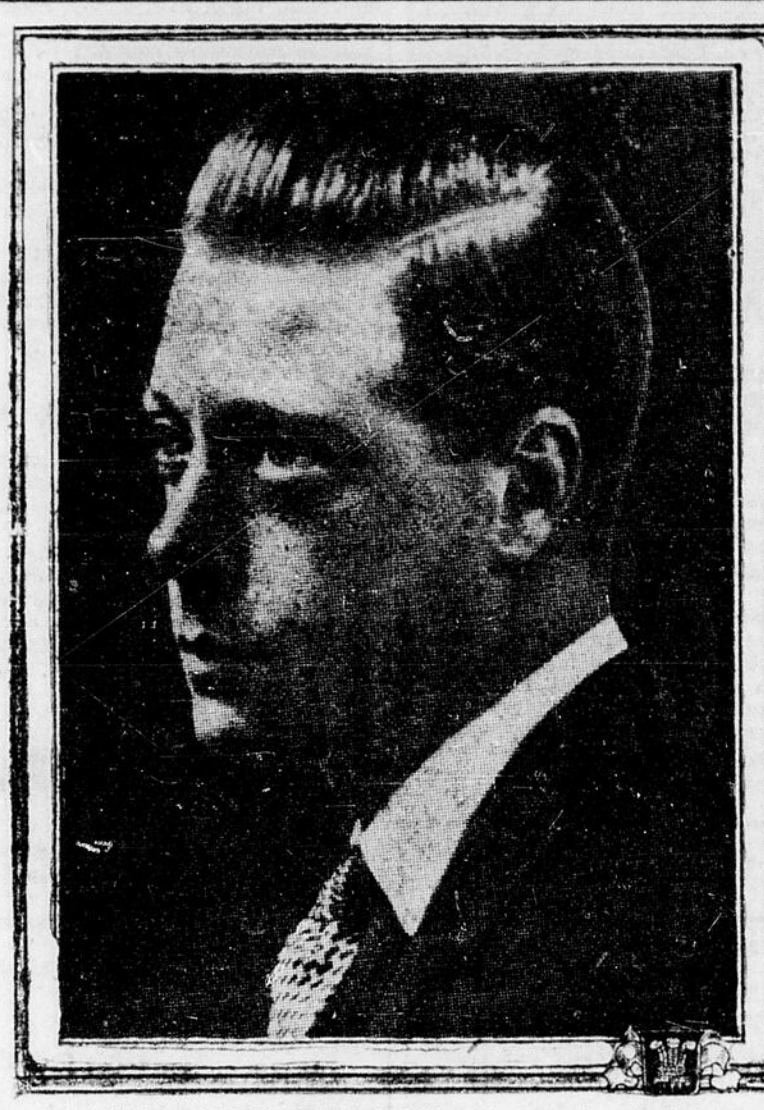
SA MAJESTÉ LE ROI EDOUARD VIII, (hier le prince de Galles), succède automatiquement à son père le feu roi Georges V.

C'EST la grande distinction de notre nouveau souverain que d'avoir su devenir le jeune homme le plus populaire du monde pendant ces années mêmes au cours desquelles tant de trônes ont tombé ou chancelé en Europe et en Asie, dans le même temps que la monarchie faiblissait considérablement dans le monde sous la poussée démocratique, dans la période de délire qui suivit la fin de la Grande Guerre. Alors que tant de sceptres tombaient, la couronne d'Angleterre affirmait son prestige et son autorité.